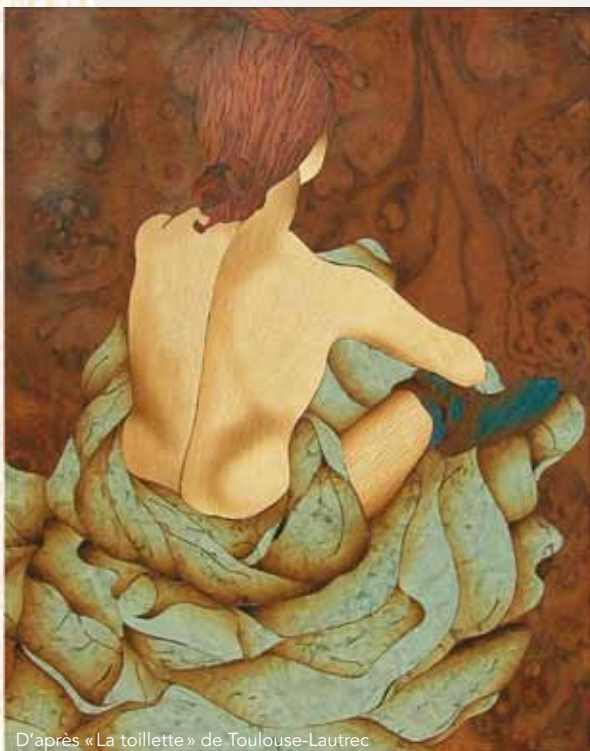
D'après « La toilette » de Toulouse-Lautrec